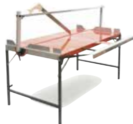
TABLE DE COUPE PAROC NOUVEAU