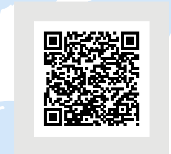
Demande / informations techniques